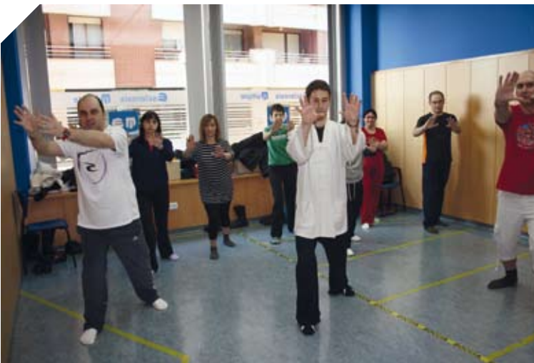
Grupo de Tai Chi.