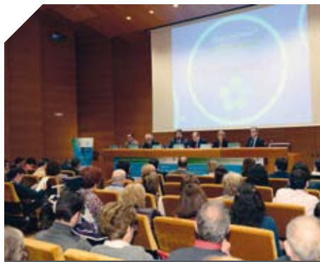
Jornada Científica Día Mundial de la EM.