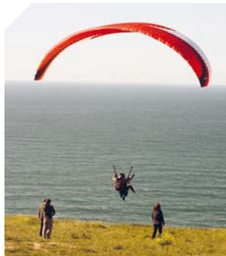
Vuelo en parapente adaptado.