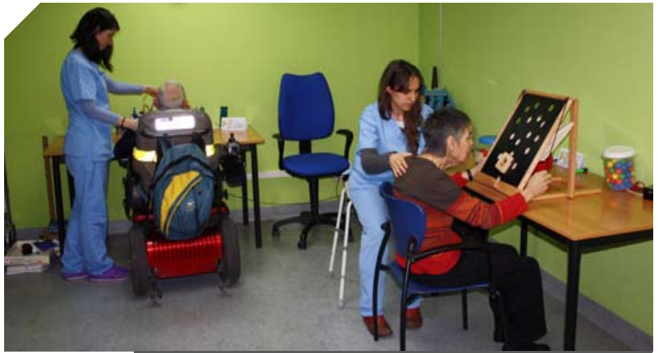
El objetivo de la terapia ocupacional es conseguir la máxima independencia de la persona.

En 2013 se han realizado 1.662 sesiones de terapia ocupacional, atendido a una