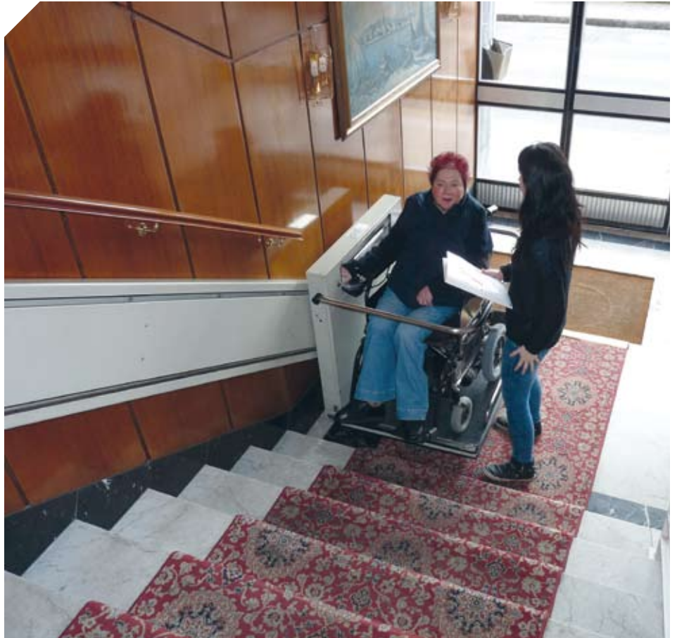
Las terapeutas asesoran para buscar las mejores soluciones a los problemas de accesibilidad en los domicilios.

Este servicio ayuda a solucionar, todas las dudas de las personas sobre cómo solucionar determinadas barreras de su entorno, ya sea mediante ayudas técnicas y/o adaptaciones o cambios en la estructura del domicilio, el portal, el baño, etc. El objetivo de las ayudas técnicas y las adaptaciones es proporcionar autonomía, seguridad y ayudar en las limitaciones