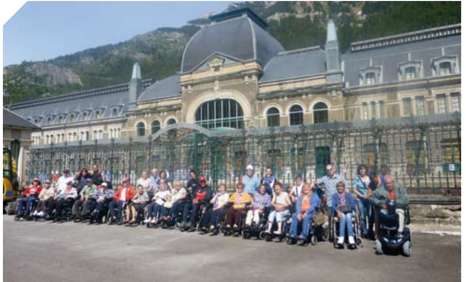
Viaje de vacaciones en Huesca.

Se han realizado un total de 13 salidas, en las que usuarios y socios de ADEMBI han disfrutado de diferentes recursos de entretenimiento y tiempo libre de nuestro entorno, de forma normalizada y accesible. Destacan las salidas a la playa en verano y el vuelo en parapente adaptado.