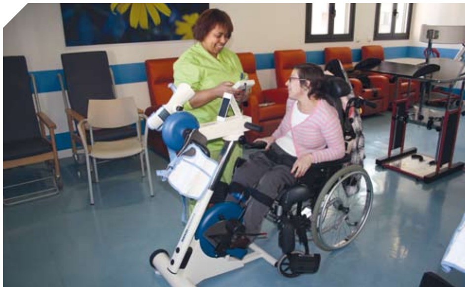
Una residente durante una sesión en la bicicleta pasiva.

Además cuentan con un programa de mecanoterapia que complementa las sesiones individuales y que ayuda a prevenir las secuelas y complicaciones causadas por la falta de movimiento. Los residentes utilizan a diario aparatos como las bicicletas pasivas para brazos y piernas y la plataforma vibratoria.