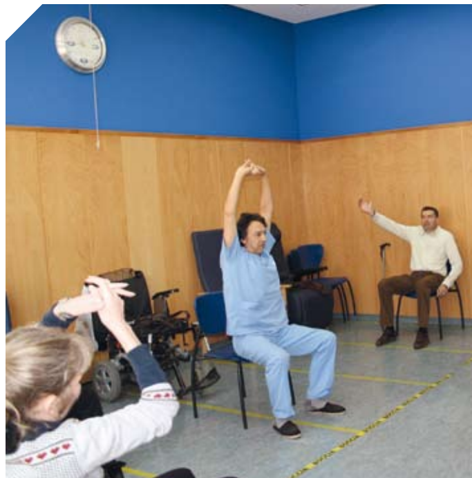
Sesión de Yoga.