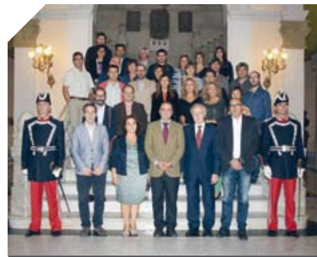
Recepción de Innovación Social en el Ayuntamiento.