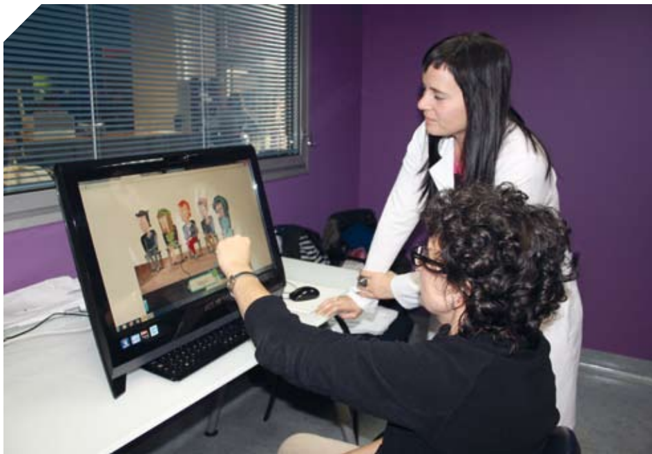
Una paciente utilizando la plataforma NeuronUP.