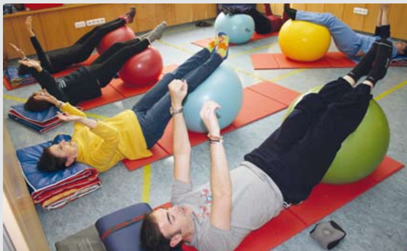
Sesión de fisioterapia grupal.

Las sesiones grupales están compuestas por un grupo de 4 personas como mínimo, manteniendo una homogeneidad, para respetar al máximo el objetivo terapéutico individual, en una terapia mucho más global. A los beneficios de la fisioterapia global, hay que añadir las relaciones interpersonales que se crean entre los usuarios.