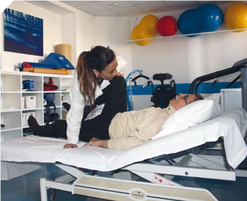
Urizaratorre cuenta con un amplio gimnasio de rehabilitación.

Los espacios de la residencia son amplios, lo que permite la movilización fácil y cómoda de todas las personas. En la planta baja se encuentra el gimnasio, una zona de centro de día y el comedor con una terraza exterior; la cocina donde se elabora la comida a diario y un almacén. En el primer piso está la zona de administración con despachos para rehabilitación y una sala con ordenadores y biblioteca. En la segunda y tercera plantas se encuentran las habitaciones de los residentes.