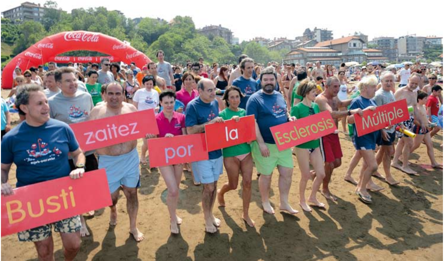
En 2013, la campaña Busti zaitez – Mójate ha batido un nuevo récord de participación, repercusión mediática y captación de fondos.