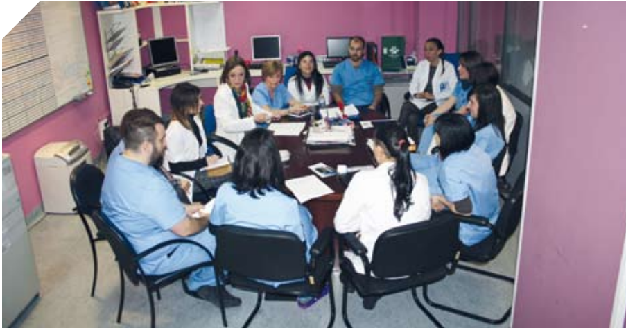
Sesión clínica del equipo multidisciplinar.