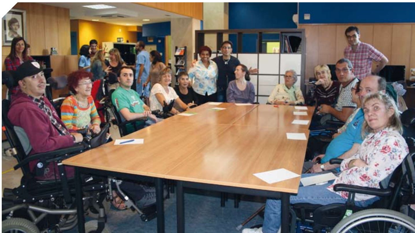
El cantante Fito Cabrales con socios de ADEMBI en su visita al Centro EM.