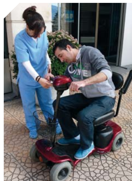
La terapeuta explica el manejo de una scooter a un usuario.

Además, se consiguen en primicia nuevos productos que salen al mercado para que los socios los puedan probar, como la cuchara 'liftware' adquirida en EE.UU., cuyo objetivo es el de corregir el temblor para facilitar la AVD de la alimentación.