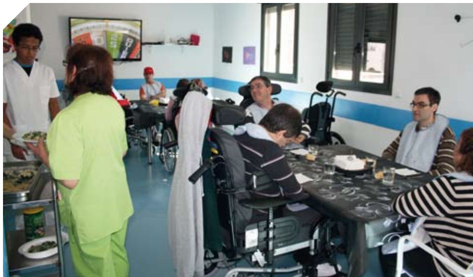
Comedor de Urizartorre.