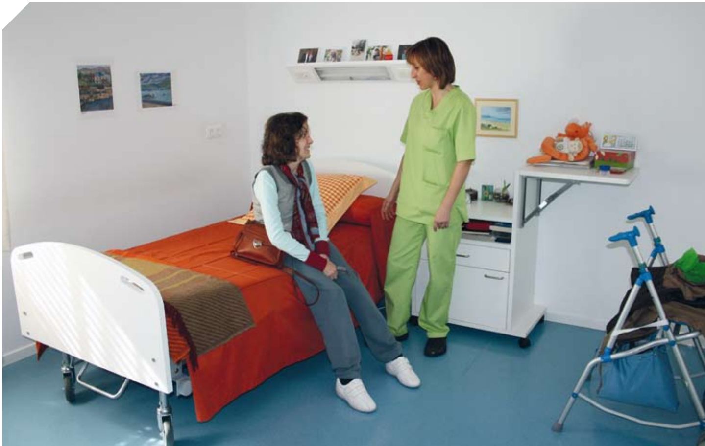
Las habitaciones son individuales, amplias y luminosas.

La Residencia Urizartorre es la primera residencia para personas con Esclerosis Múltiple de Euskadi, inaugurada en marzo de 2011. La residencia es de titularidad de la Diputación Foral de Bizkaia y gestionada por ADEMBI.