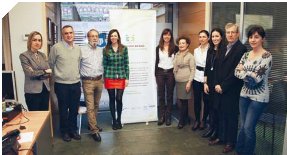
Equipo de trabajo del Protocolo Bilbao Neurología – Atención Primaria.