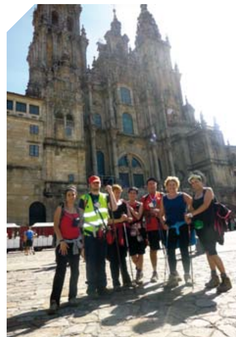
Grupo de ADEMBI que realizó el Camino de Santiago.