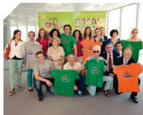
Rueda de prensa en la Torre Iberdrola.