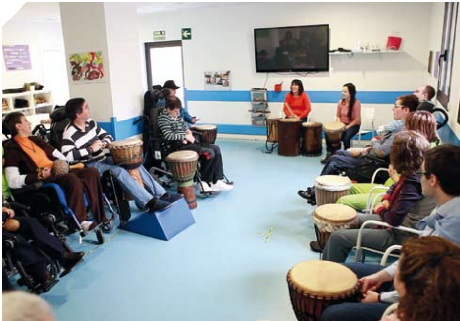
En la Residencia se realizan diferentes actividades de ocio y tiempo libre, como un taller de percusión.

como el lenguaje, la atención, el razonamiento y los turnos de interacción y, por otro lado, la mecánica respiratoria, la tos voluntaria y la coordinación fono-respiratoria.