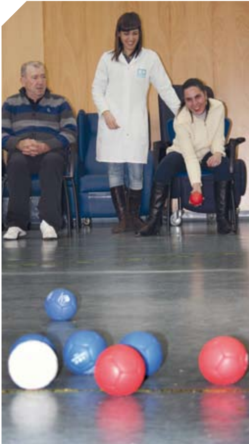
Partido de entrenamiento de Boccia.