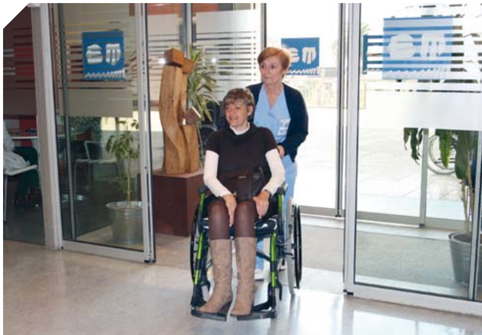
Las auxiliares acompañan a los usuarios que lo necesitan en las actividades del Centro.

También prestan apoyo en aquellas actividades en la zona social en las que el usuario precisa ayuda.