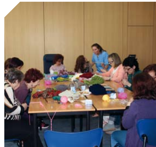
Grupo de labores en la zona social.