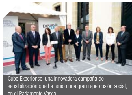
Cube Experience, una innovadora campaña de sensibilización que ha tenido una gran repercusión social, en el Parlamento Vasco.