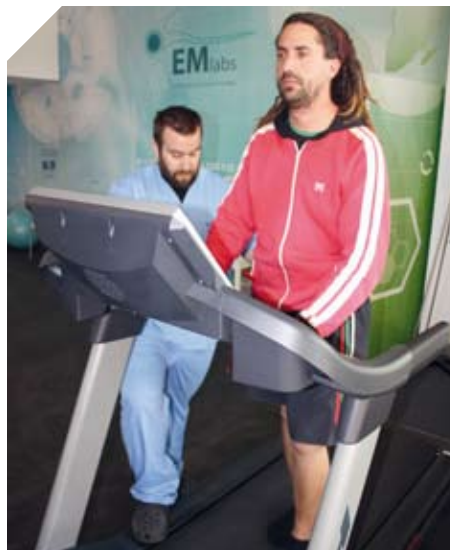
En EMlabs testando un nuevo videojuego para el entrenamiento de la marcha.

Contiene ejercicios de fisioterapia, logopedia, terapia ocupacional, neuropsicología y yoga; todos los ejercicios que se establecen para cada usuario se pautan de forma individualizada y personalizada por cada profesional. Los ejercicios pueden ser grabados si se dispone de una webcam para poder ser posteriormente analizados por el profesional y mantener un 'feed-back'.